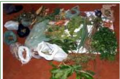
Plantas Medicinais da Caatinga