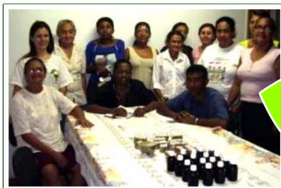
Instrutoras do CESAM, participantes da oficina, e remédios caseiros produzidos (pomadas, lambedores, sabões)