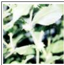
Espinho de Cigano