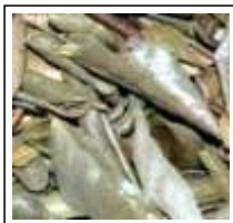
Cólica Hepática: falso Boldo do Chile (Alumã)