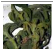
Dor de Estomago: 7 Dores