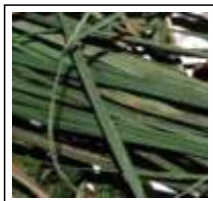
Dor de Barriga: Capim Santo

O segundo objetivo é de ter um “ Pronto Socorro Natural ”, com sete plantas para sete dores: