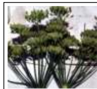
Foto: Erva doce

Chupar o pau de canela e tomar o chá da erva doce ajudam a lutar contra o vômito e a passar o enjôo.