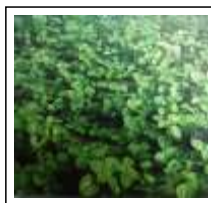
Dor de Dente: Pega-rapaz

ARRUDA - Cuidado! Não tomar arruda de jeito nenhum se estiver grávida. Homens também não podem usar porque pode provocar impotência sexual.