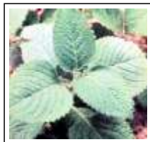
Dor de Ouvido: Hortelã Graúda