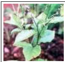
Dor de Cabeça: Atipim