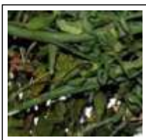
Dor de Menstruação: Arruda