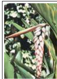
Foto: Flor de colônia

Diminuir o sal na comida e comer mais alho e cebola. Tomar o lambedor do chuchu. O chá da folha de cana, da flor de colônia e do capim santo também são diuréticos e ajudam a baixar a pressão.