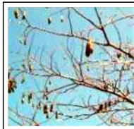
Foto: Umburana de Cheiro

Tome o chá abafado da casca da Umburama de Cheiro que ajuda a abrir os pulmões.